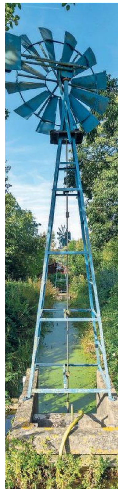
De molens draaien niet meer.