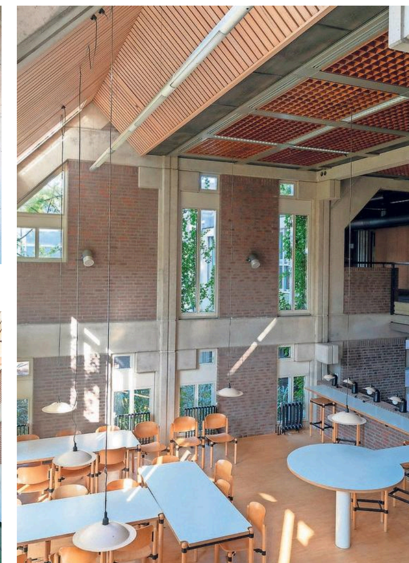
In de jaren tachtig een hypermoderne opstelling.

„Het verval zie je wel. Als een pand niet gebruikt wordt, kan het heel snel gaan”