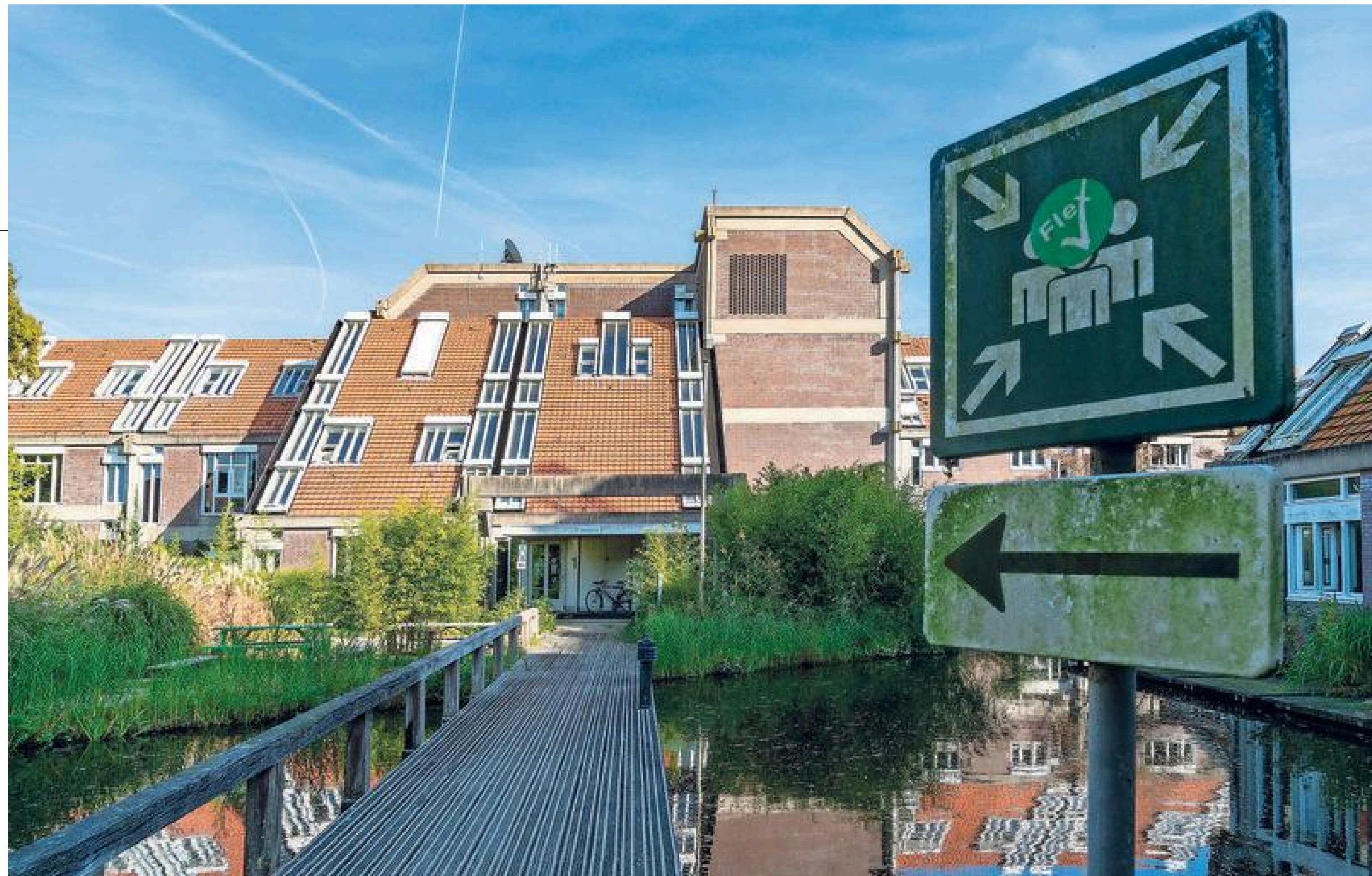
PEN-dorp wordt vervangen door een nieuw stadsdeel.

Grote delen van het terrein zijn afgezet, zegt hij. „Het nodigt anders uit om te dwalen.” Dat geldt